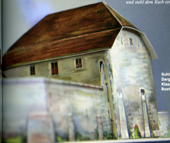
Schloss Sargans – ein Klassiker der Bastelbogen